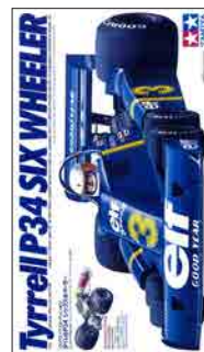
1/20 グランプリコレクション 1977 ~

全国のプラモデル出荷量の約9割を担い、模型の世界首都と言われる静岡に70年以上模型を作ってきた「タミヤ」があります。ツインスターと呼ばれる星のマークのついた模型は日本のみならず世界中で愛されてきました。本物の持つ流麗なスタイルや、機能美を凝縮させたスケールモデル。パワフルなスピードをコントロールするラジオコントロールカー。手のひらサイズに本格的なレーシングの要素が詰まったミニ四駆など、なぜタミヤの模型が人々に愛されてきたのか会場でご体感ください。また本展ではタミヤから模型化された「F1マシン「タイレル P34 シックスホイラー」の実車を展示。少年たちの心を驚かした本物のレーシングカーもご覧いただけます。