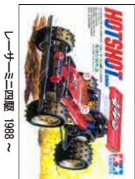
1/48 車ニ四駆 1988 ~