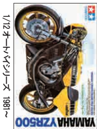
1/12 オートバイシリーズ 1981 ~