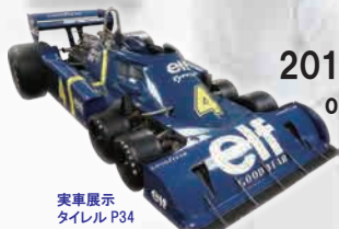
実車展示 タイレル P34

※( )内は、前売り券及び20名以上の団体割引料金 ※その他、各種入館料割引(10%割引) ※前売り券は、I.JTB チケット取り扱いのコンビニ各店にてお求めいただけます。 I.JTB 商品番号⇒0243635 (「チケットぴあ」ではお取り扱いできません)