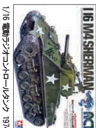
1/16 電動ラジオコントロールタンク 1974 ~