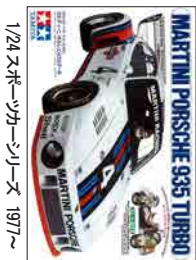
1/24 スポーツカーシリーズ 1977 ~